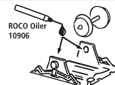
ROCO Oiler 10906

Les pièces de finition illustrées sont à monter par le modéliste. Le jeu de pièces peut comprendre d'autres pièces (non illustrées) qui sont destinées à autres versions du modèle et qui sont superflus à la variante présente.