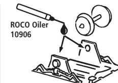
ROCO Oiler 10906

Les pièces de finition illustrées sont à monter par le modéliste. Le jeu de pièces peut comprendre d'autres pièces (non illustrées) qui sont destinées à autres versions du modèle et qui sont superflus à la variante présente.