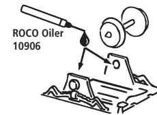
ROCO Oiler 10906

Les pièces de finition illustrées sont à monter par le modéliste. Le jeu de pièces peut comprendre d'autres pièces (non illustrées) qui sont destinées à autres versions du modèle et qui sont superflus à la variante présente.